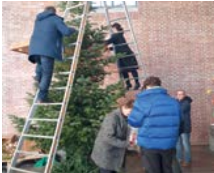
Abschmücken des Christbaums

Für die Christmette um 23 Uhr am Weihnachtsfest wurde unsere Andreaskirche besonders stimmungsvoll ausgeleuchtet.